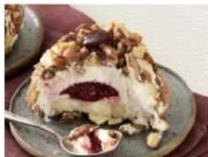
206. CROCCANTE ALL'AMARENA dessert semifreddo con crema al gusto vaniglia, con cuore all'amarena, decorato con mandorle caramellate 5.00€