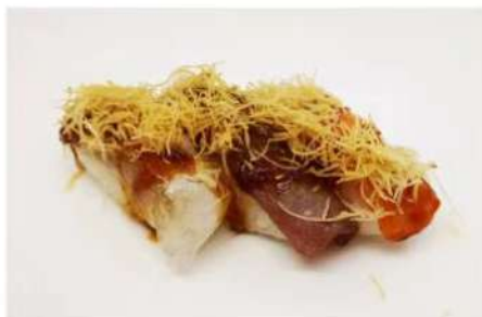
92. 🍣 MIX FIRE 1 salmone, 1 tonno, 1 branzino scottati salsa teriyaki 6.00€