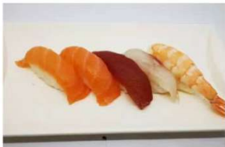
90. 🍣🍣 SMALL NIGIRI 5PZ 2 salmone, 1 tonno, branzino, 1 gambero 5.00€