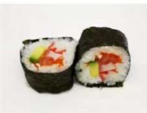
87. 🍣 KANI FUTO salmone surimi avocado e tobiko 6.00€