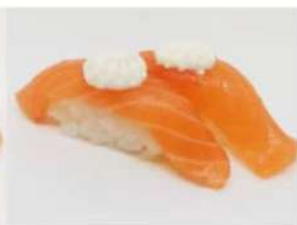
200. 🍣🍣 WHITE NIGIRI salmonè philadelphia 3.50€