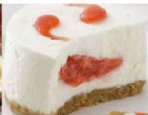
210. STRAWBERRY CHEESECAKE crema al formaggio farcita e decorata con salsa di fragole su base di biscotto 5.00€