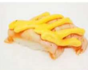
27. 🍣 SAKE FLAMBÉ salmonè e salsa rosa scottata 4.00€