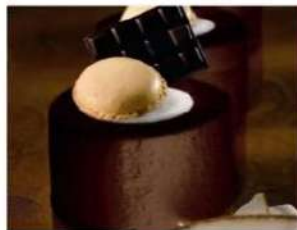
215. RONDO' COCCO E CIOCCOLATO gelato al cioccolato amaro e gelato al cocco, decorati con cioccolato e meringa 5.00€