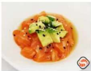
40. 🍣 SAKE TARTARE salmone avocado sesamo e salsa ponzu 8.00€