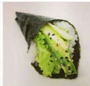
48. 🍣🥗 VEGGIE TEMAKI insalata cetriolo avocado philadelphia sesamo 2.50€