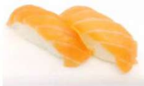
20. 🍣🍣 SAKE NIGIRI salmonè riso 3.00€

PEZZI DI PESCE SU POLPETTINE DI RISO GOHAN