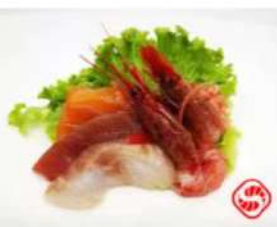
103. 🌟🍴 SASHIMI FULL MIX 1 fette di salmone, 1 fette di tonno 1 fette di branzino, 2 gamberi rossi 10.00€