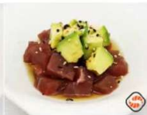
41. 🍣 MAGURO TARTARE tonno avocado sesamo e salsa ponzu 10.00€