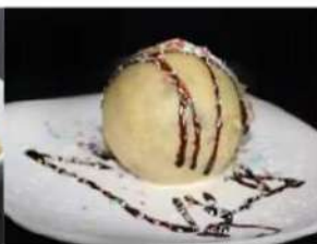
201. GELATO FRITTO 3.50€