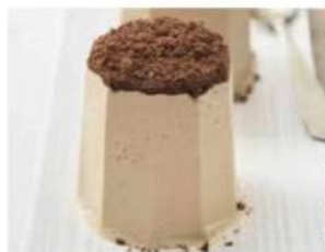
212. SEMIFREDDO AL CAFFÈ gelato semifreddo alla nocciola, con cuore di cioccolato liquido, decorato con nocciole pralinate e meringa 5.00€