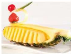
203. ANANAS FRESCO 3.50€