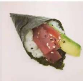
44. 🍣🍌 MAGURO TEMAKI tonno avocado sesamo 4.00€