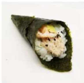
46. 🍣 KALI TEMAKI gambero cotto tonno cotto avocado maio sesamo 3.50€