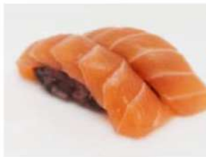
201. 🍣🍣 BLACK SAKE riso venere salmonè 3.00€