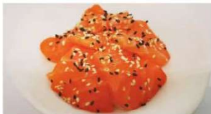
104. 🌟🍴 SAKE CHIRASHI sashimi salmone su un letto di riso sushi e sesamo 8.00€