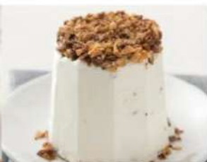
211. SEMIFREDDO AL TORRONCINO gelato semifreddo al torroncino decorato con granella di nocciole pralinate 5.00€