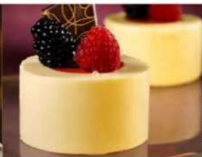
216. RONDO' VANIGLIA E FRAGOLA gelato alla vaniglia e gelato alla fragola, decorati con lampone mora e cioccolato 5.00€