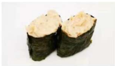
37. KALI GUNKAN riso in alga nori tonno cotto maio 3.50€