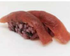
202. 🍣🍣 BLACK MAGURO riso venere tonno 3.50€