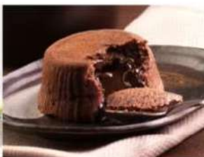
204. SOUFFLÉ AL CIOCCOLATO soufflé con cuore di cioccolato liquido 5.00€