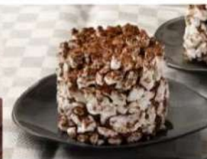
207. MERINGA ALLA CIOCCOLATA meringa farcita con crema al cioccolato fondente, ricavato da pasta di cacao di santo domingo 5.00€