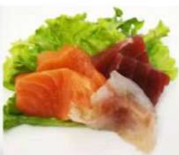
102. 🌟🍴 SASHIMI MIX 2 fette di salmone, 2 fette di tonno 2 fette di branzino 8.00€