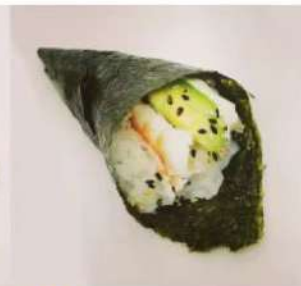
45. 🍣🍌 EBI TEMAKI gambero cotto phila avocado sesamo 3.00€