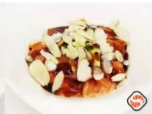
42. 🍣 MANDORLE TARTARE salmone avocado salsa teriyaki e mandorle 9.00€