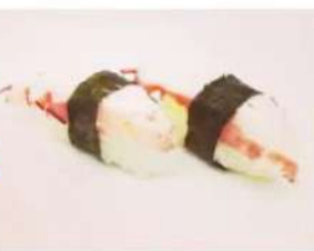
24. 🍣🍣 TAKO NIGIRI polipo riso alga nori 3.00€