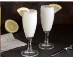
217. SORBETTO LIMONE 3.00€