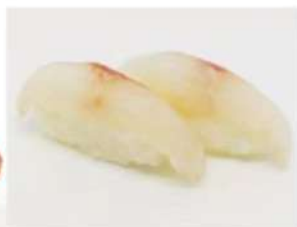
22. 🍣🍣 SUZUKI NIGIRI branzino riso 3.00€