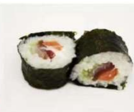
86. 🍣🍣 SEA FUTO salmone tonno branzino philà e avocado 7.00€