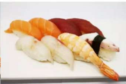
91. 🍣🍣 LARGE NIGIRI 8PZ 2 salmone, 2 tonno, 2 branzino, 1 gambero, 1 polipi 7.00€