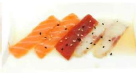
107. 🍴 CARPACCIO MIX salmone branzino tonno sesamo e salsa wasabi citrus 7.00€