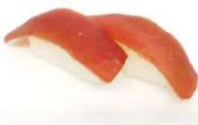
21. 🍣🍣 MAGURO NIGIRI tonno riso 3.50€