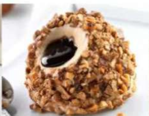
213. TARTUFO NOCCIOLA gelato semifreddo alla nocciola con cuore di cioccolato liquido decorato con nocciole pralinate e meringa 5.00€