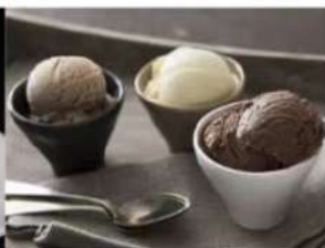
202. GELATO 1 PALLINA A SCELTA riso, the verde, crema, cioccolato, mela verde, mandarino 1.00€