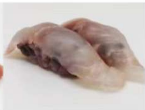
203. 🍣🍣 BLACK SUZUKI riso venere branzino 3.00€