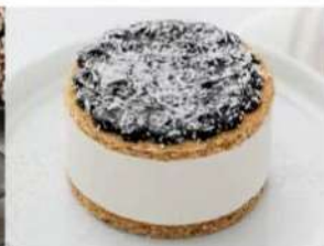
208. COCCO NOCCIOLA biscotto alla nocciola farcito con crema al gusto di cacao e crema alla nocciola, decorato con cocco rapè 5.00€