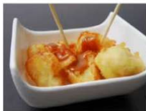
200. FRITTA MISTA DI FRUTTA 3.50€