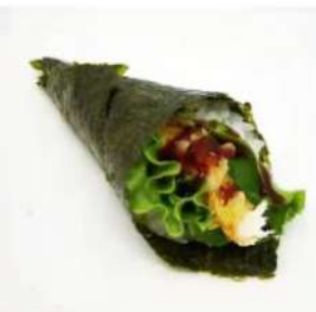
47. 🍣 TEMPURA TEMAKI gambero fritto maio insalata salsa teriyaki 3.50€