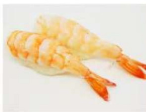
23. 🍣🍣 EBI NIGIRI gambero cotto riso 3.00€