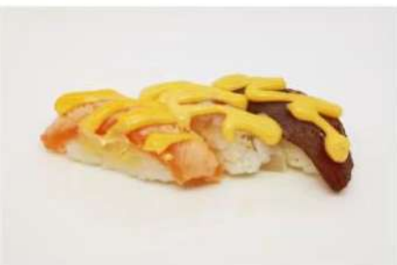
93. 🍣 MIX FLAMBÈ 1 salmone, 1 tonno, 1 branzino salsa rosa flambato 7.00€