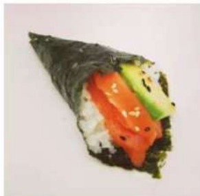
43. 🍣🍌 SAKE TEMAKI salmone philadelphia avocado sesamo 3.00€

ARROTOLATO A FORMA DI CONO, DA MANGIARE CON LE MANI