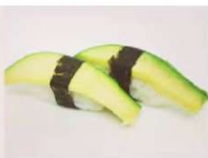
25. 🍣🍣 AVOCADO NIGIRI avocado riso e alga nori 3.00€