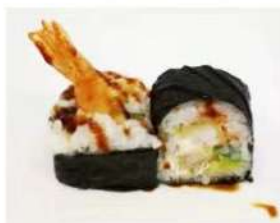
85. 🍣 EBI FUTO gambero fritto philà avocado tobiko salsa teriyaki 6.00€

ARROTOLATI CON ALGA NORI, CON MOLTI INGREDIENTI ALL'INTERNO, OGNI PEZZO È MOLTO GRANDE. L'ALGA PUÒ ESSERE FUORI O DENTRO