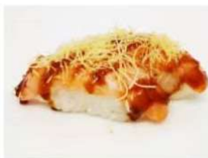
26. 🍣 SAKE FIRE salmonè scottato salsa teriyaki e kataifi 4.00€