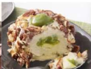
205. CROCCANTE AL PISTACCHIO dessert semifreddo con crema al pistacchio, con cuore al pistacchio decorato con granella di mandarino caramellizzate 5.00€