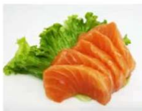
101. 🌟🍴 SASHIMI SALMONE 5 fette di pesce crudo 6.00€