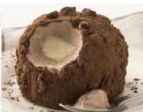
214. TARTUFO CLASSICO gelato semifreddo allo zabaione e gelato al cioccolato, decorato con granella di nocciole e cacao 5.00€