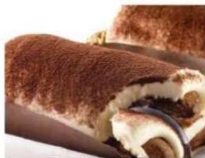
209. TIRAMISÙ SAVOIARDI crema al mascarpone e savoiardi inzuppati al caffè 5.00€