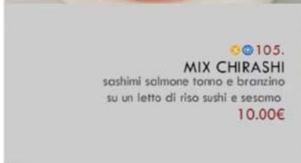
🌟🍴 105. MIX CHIRASHI sashimi salmone tonno e branzino su un letto di riso sushi e sesamo 10.00€