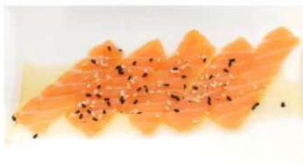
106. 🍴 CARPACCIO SAKE salmone sesamo e salsa wasabi citrus 5.00€