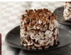
207. MERINGA ALLA CIOCCOLATA meringa farcita con crema al cioccolato fondente, ricavato da pasta di cacao di santo domingo 5.00€