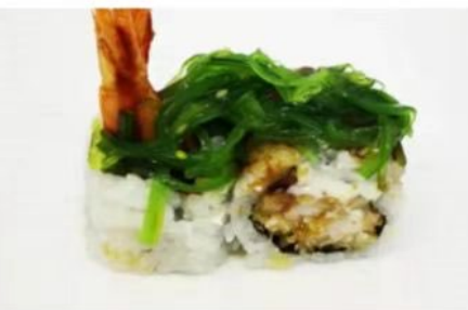
72. 🇮🇹 TROPICAL EBITEN Roll di riso farcito con gamberi fritti maio guarnito con salsa teriyaki e wakame 10.00€