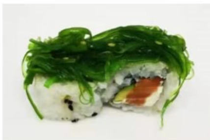
71. 🇮🇹 TROPICAL ROLL roll di riso farcito con salmone phila avocado guarnito con wakame 10.00€