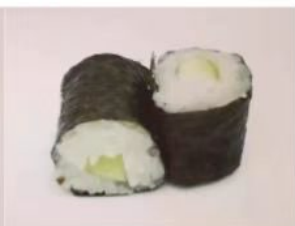
55. 🍣🌱 KAPPA MAKI cetriolo riso in alga nori 2.50€