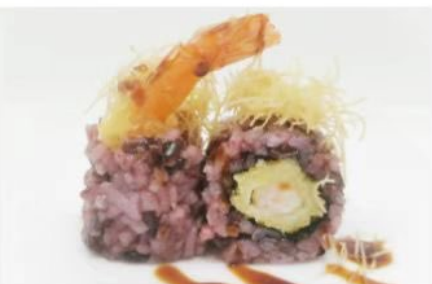
212. 🍣 BLACK VEGGIE riso venere cetriolo insalata avocado philadelphia 6.50€