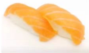
20. 🍣🍣 SAKE NIGIRI salmone riso 3.00€

PEZZI DI PESCE SU POLPETTINE DI RISO GOHAN