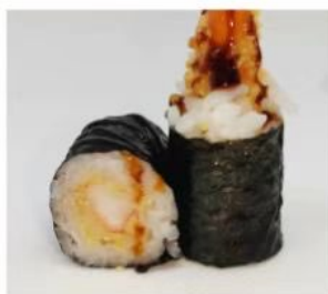
204. 🍣 HOSO TEMPURA gambero fritto e salsa teriyaki 3.50€