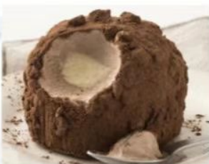
214. TARTUFO CLASSICO gelato semifreddo allo zabaione e gelato al cioccolato, decorato con granella di nocciole e cacao 5.00€