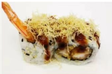
70. 🇮🇹 EBITEN gamberi fritti mayo salsa teriyaki kataifi e sesamo 7.00€