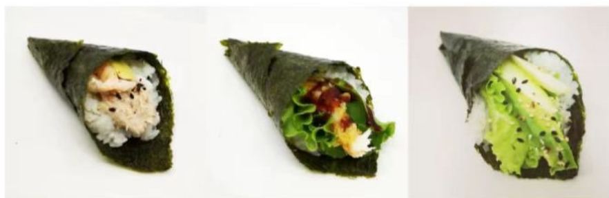
46. 🍣🌱 KALI TEMAKI gambero cotto tonno cotto avocado maio sesamo 3.50€