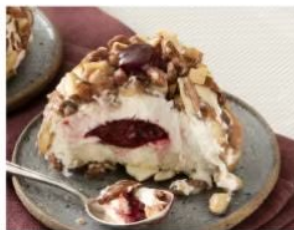
205. CROCCANTE ALL'AMARENA dessert semifreddo con crema al gusto vaniglia, con cuore all'amarena, decorato con mandorle caramellizzate 5.00€