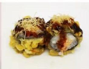
57. 🍣 FRY SAKETEN sake maki in tempura salsa teriyaki kataifi 6.00€