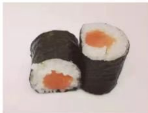
50. 🍣🍣 SAKE MAKI salmone riso in alga nori 3.00€

PICCOLI ARROTOLATI CON ALGA NORI SULLA PARTE ESTERNA