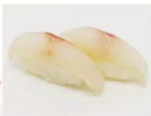
22. 🍣🍣 SUZUKI NIGIRI branzino riso 3.00€