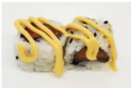
66. 🇧🇷 🇮🇹 SPICY SALMONE ROLL salmone crudo salsa spicy mayo e sesamo 7.00€

ARROTOLATO CON ALGA ALL'INTERNO E RISO ALL'ESTERNO SOLITAMENTE CON SEMI DI SESAMO O TOBIKO.