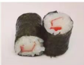
54. 🍣 KANI MAKI surimi riso in alga nori 3.00€