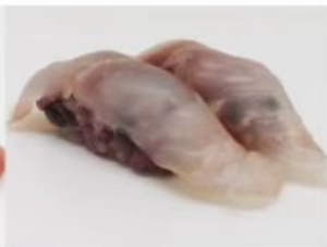
203. 🍣🍣 BLACK SUZUKI riso venera branzino 3.00€