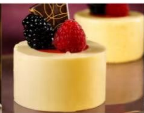
216. RONDO' VANIGLIA E FRAGOLA gelato alla vaniglia e gelato alla fragola, decorati con lampone mora e cioccolato 5.00€