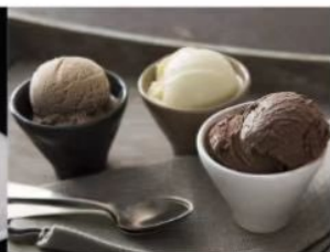
202. GELATO 1 PALLINA A SCELTA Riso, The Verde, Crema, Cioccolato, Fragola, Ananas, Limone 1.00€