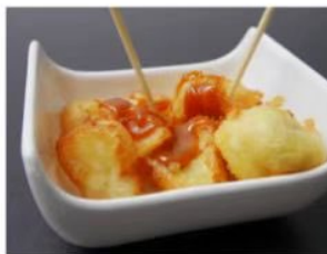
200. FRITTA MISTA DI FRUTTA 3.50€