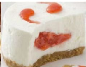
210. STRAWBERRY CHEESECAKE crema al formaggio farcita e decorata con salsa di fragole su base di biscotto 5.00€