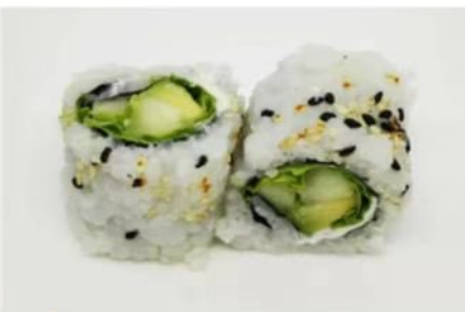
68. 🇨🇦 🇮🇹 VEGGIE ROLL Insalata cetriolo avocado philadelphia e sesamo 6.00€