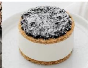
208. COCCO NOCCIOLA biscotto alla nocciola farcito con crema al gusto di cocco e crema alla nocciola, decorato con cocco rapè 5.00€