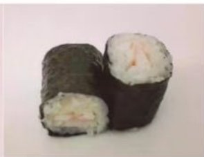
52. 🍣🍣 EBI MAKI gamberi cotti riso in alga nori 3.00€