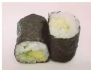
56. 🍣🌱 AVOCADO MAKI avocado riso in alga nori 3.00€