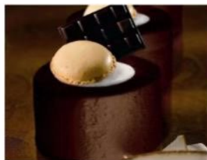
215. RONDO' COCCO E CIOCCOLATO gelato al cioccolato amaro e gelato al cocco, decorati con cioccolato e meringa 5.00€