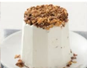
211. SEMIFREDDO AL TORRONCINO gelato semifreddo al torroncino decorato con granella di nocciole pralinate 5.00€