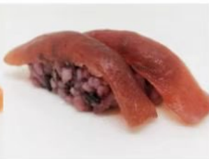
202. 🍣🍣 BLACK MAGURO riso venera tonno 3.50€