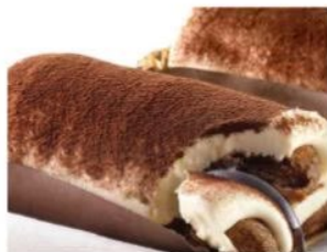
209. TIRAMISÙ SAVOIARDI crema al mascarpone e savoiardi inzuppati al caffè 5.00€