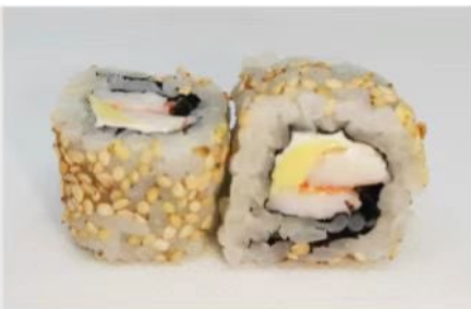
209. 🍣🍣 EBI ROLL gambero cotto avocado philadelphia sesamo 7.00€