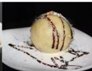
201. GELATO FRITTO 3.50€