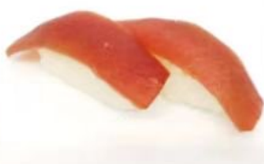
21. 🍣🍣 MAGURO NIGIRI tonno riso 3.50€