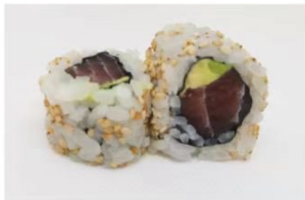
207. 🍣🍣 TUNA ROLL tonno e avocado sesamo 8.00€

ARROTOLATO CON ALGA ALL'INTERNO E RISO ALL'ESTERNO SOLITAMENTE CON SEMI DI SESAMO O TOBIKO.