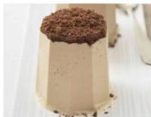
212. SEMIFREDDO AL CAFFÈ gelato semifreddo alla nocciola, con cuore di cioccolato liquido, decorato con nocciole pralinate e meringa 5.00€