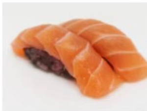
201. 🍣🍣 BLACK SAKE riso venera salmone 3.00€