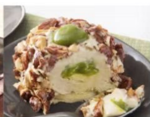
205. CROCCANTE AL PISTACCHIO dessert semifreddo con crema al pistacchio, con cuore al pistacchio decorato con granella di mandorle caramellizzate 5.00€