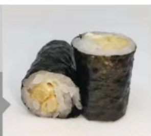
205. 🍣 POTATO MAKI patatine fritte e maionese 2.50€