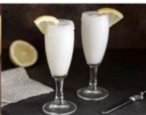
217. SORBETTO LIMONE 3.00€