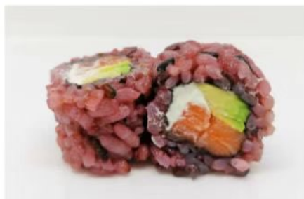
210. 🍣🍣 BLACK PHILADELPHIA riso venere salmone avocado philadelphia 7.50€