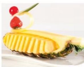
203. ANANAS FRESCO 3.50€