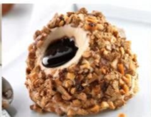
213. TARTUFO NOCCIOLA gelato semifreddo alla nocciola con cuore di cioccolato liquido decorato con nocciole pralinate e meringa 5.00€