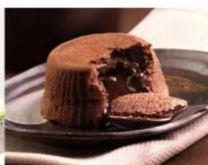
204. SOUFFLÉ AL CIOCCOLATO soufflé con cuore di cioccolato liquido 5.00€