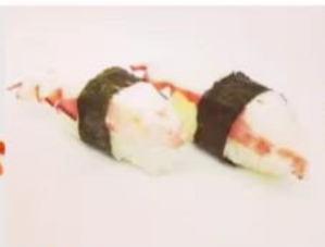
24. 🍣🍣 TAKO NIGIRI polipo riso alga nori 3.00€