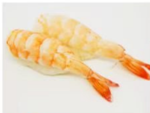
23. 🍣🍣 EBI NIGIRI gambero cotto riso 3.00€