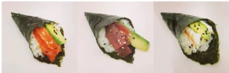
43. 🍣🌱 SAKE TEMAKI salmone philadelphia avocado sesamo 3.00€

ARROTOLATO A FORMA DI CONO, DA MANGIARE CON LE MANI