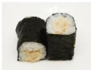
53. KALI MAKI tonno cotto maio riso in alga nori 3.50€