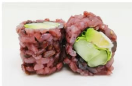
212. 🍣🍣 BLACK VEGGIE riso venere cetriolo insalata avocado philadelphia 6.50€