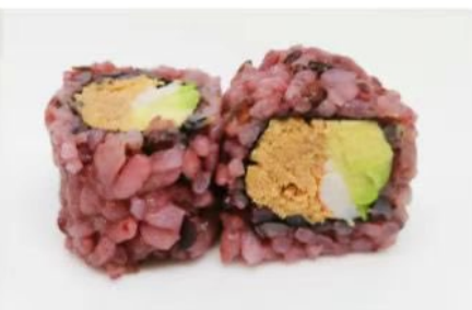
211. 🍣 BLACK CALIFORNIA riso venere tonno in scatola gamberi cotti maionese avocado 7.50€