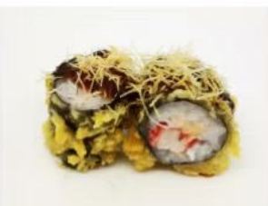
58. 🍣 FRY KANITEN kani maki in tempura salsa teriyaki kataifi 5.00€