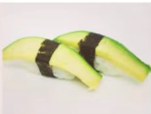
25. 🍣🍣 AVOCADO NIGIRI avocado riso e alga nori 3.00€