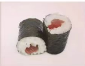
51. 🍣🍣 MAGURO MAKI tonno riso in alga nori 4.00€