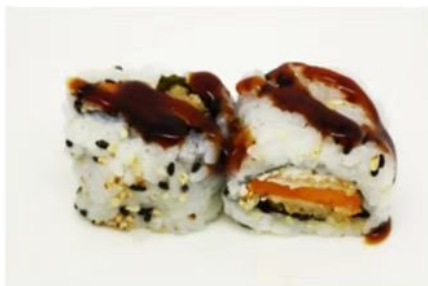
69. 🇮🇹 VEGITEN ROLL zucca in tempura philadelphia salsa teriyaki e sesamo 8.00€